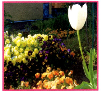
☆ 医院裏の花壇です ☆