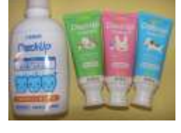
洗口液・歯磨剤 (販売しています)

虫歯の予防でフッ素の効果期待できるのは、乳歯と永久歯（生え始め～3年までの歯）といわれています。毎日継続して使用することで、エナメル質が強化されるのでフッ素入りの歯磨剤・洗口液を積極的に使用することをおすすめします。