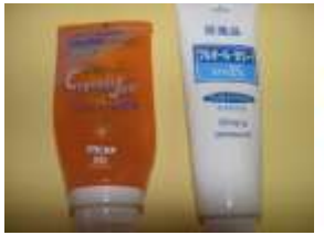
院内で使用している歯磨剤 (右・販売しています)