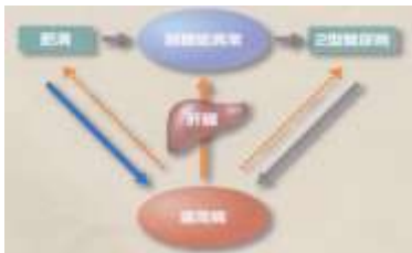
肥満が主な原因となり耐糖能異常の状態を経て2型糖尿病が発症する。最近の研究から歯周病と肥満は直接関連しているようである。歯周病原細菌の内毒素(LPS)の刺激で肝臓は脂肪組織にトリグリセリドの沈着が起り肥満の原因となっている可能性がある。肝臓は脂質代謝、糖代謝を担う重要な組織である。