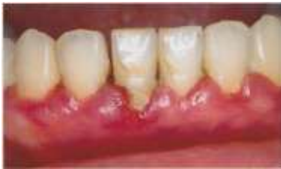
ブラッシング後の歯肉